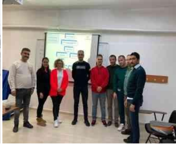
Fakültemiz 2022 yılı İlk Yardım Merkezi Tarafından Verilmiş olan Temel İlk Yardım Eğitiminden Bir Kesit.

Ayrıca yine 2018 yılı içinde “AVRASYA SAĞLIK BİLİMLERİ DERGİSİ” (EURASIAN JOURNAL OF HEALTH SCIENCES) faaliyete başlamıştır. 2019 Yılında dört cilt şeklinde yayın hayatına devam etmiştir ( https://dergipark.org.tr/tr/pub/avrasyasbd ).