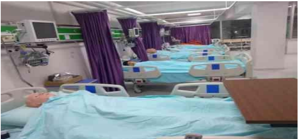
Fakültemizde Yer Alan Laboratuvarlarından Kesit.