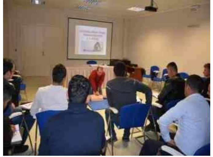
Fakültemiz 2019 yılı İlk Yardım Merkezi Tarafından Verilmiş olan Temel İlk Yardım Eğitiminden Bir Kesit.