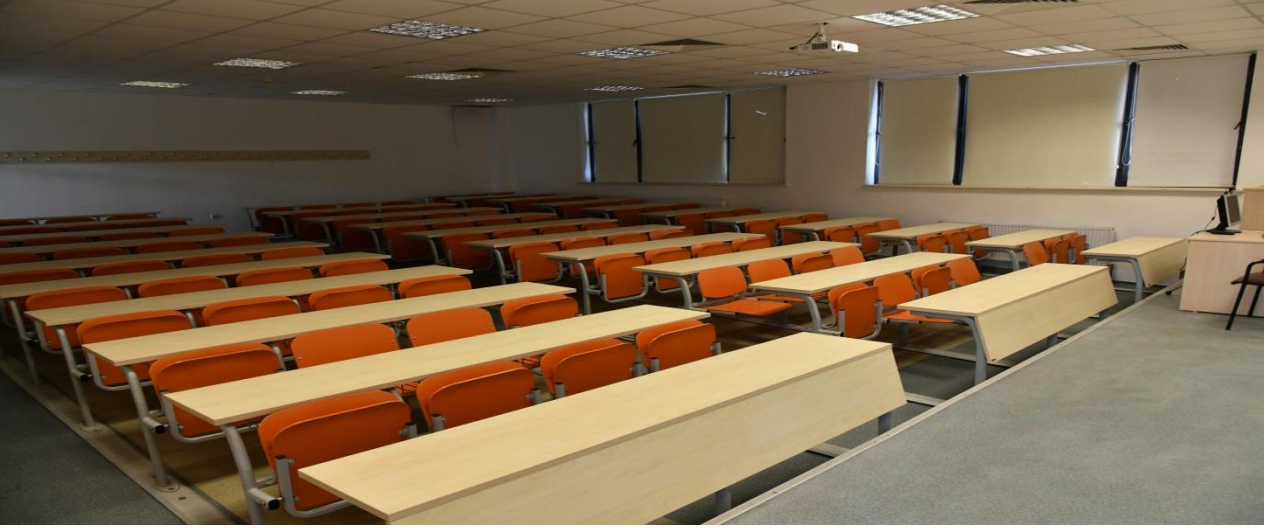
Fakültemizde Yer Alan Dersliklerden Bir Kesit.